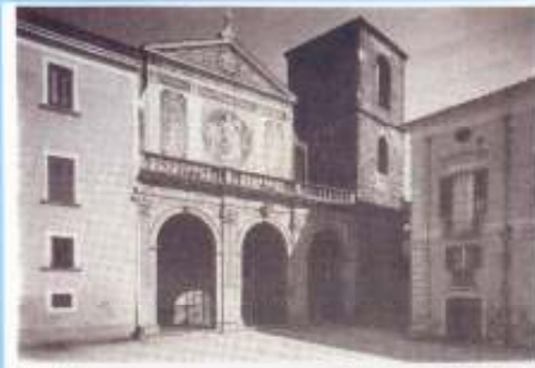
1942 L'ESTERNO DELLA CATEDRALE NEL 1942