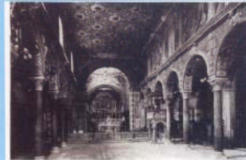
1942 L'INTERNO DELLA CATEDRALE NEL 1942