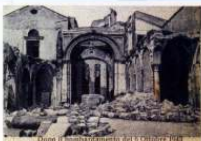
Dopo il bombardamento del 6 Ottobre 1943