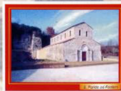
S. Paride ad Fontem